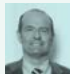
Dr. Paolo Manzoni Hospital Degli Infermi Italia