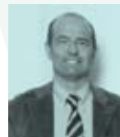
Dr. Paolo Manzoni Hospital Degli Infermi Italia